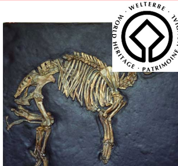
Grube Messel Darmstadt oder